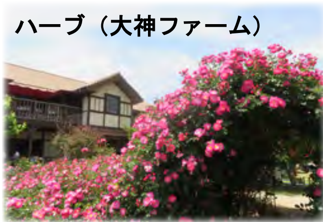
ハーブ（大神ファーム）