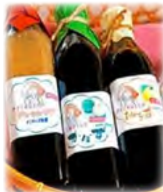
カボスを使ったドレッシング