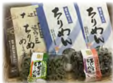
別府湾で獲れたちりめんの加工品