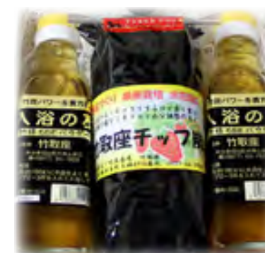
竹酢液を使用した入浴剤 （竹酢液製品）