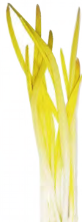
にんにく スプラウト