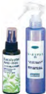
ハーブ（ユーカリ）のスプレー