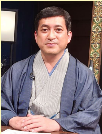
(オンラインによる講演)