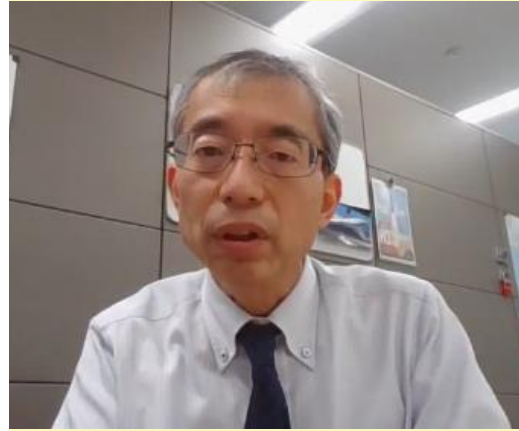
（オンラインによる講演の様子）