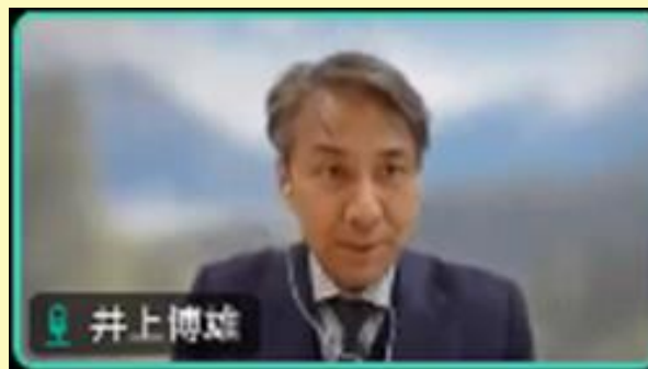
(オンラインによる講演の様子)