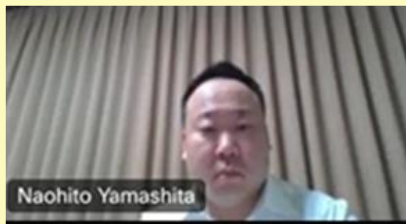
（オンラインでの講演の様子）