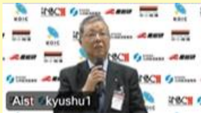
（オンラインでの講演の様子）