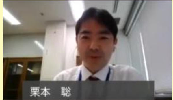
（オンラインでの講演の様子）