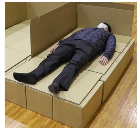
ダンボール製ベッド