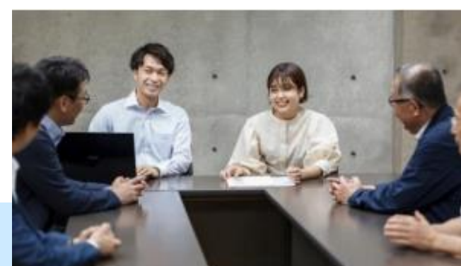
社員にプレゼンを行うインターンシップ生