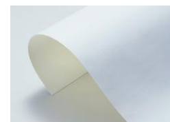
グローバルニッチトップ製品 ChukohSky(TM)FGT-800