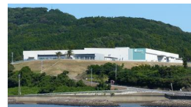
創業の地、長崎県松浦市のFI工場。 最新設備で屋根材を製造