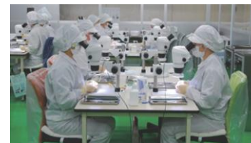
「精密プレス金型なら 藤井精工」 という圧倒的技術力