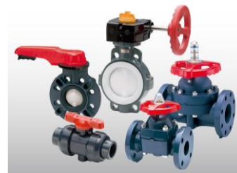
グローバルニッチトップ 製品 ASAHI AV バルブ