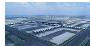
スワンナプーム国際空港 (タイ・バンコク)