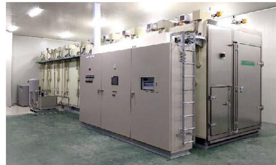
グローバルニッチトップ 製品「蒸熱処理装置」