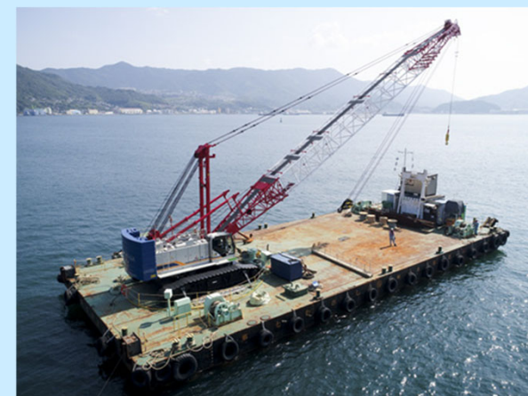
クレーン付き台船