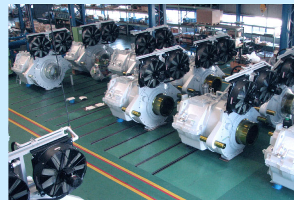
風力発電用増速機