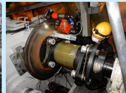
ナセル内定期点検