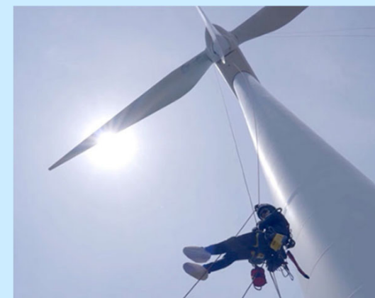
風車点検作業