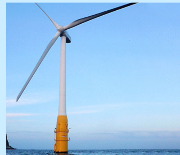
浮体式洋上風車用増速機