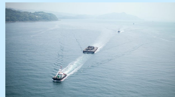
曳航業務