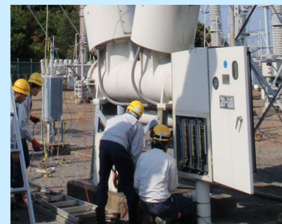
220 kVガス遮断器外部点検 (制御盤点検)