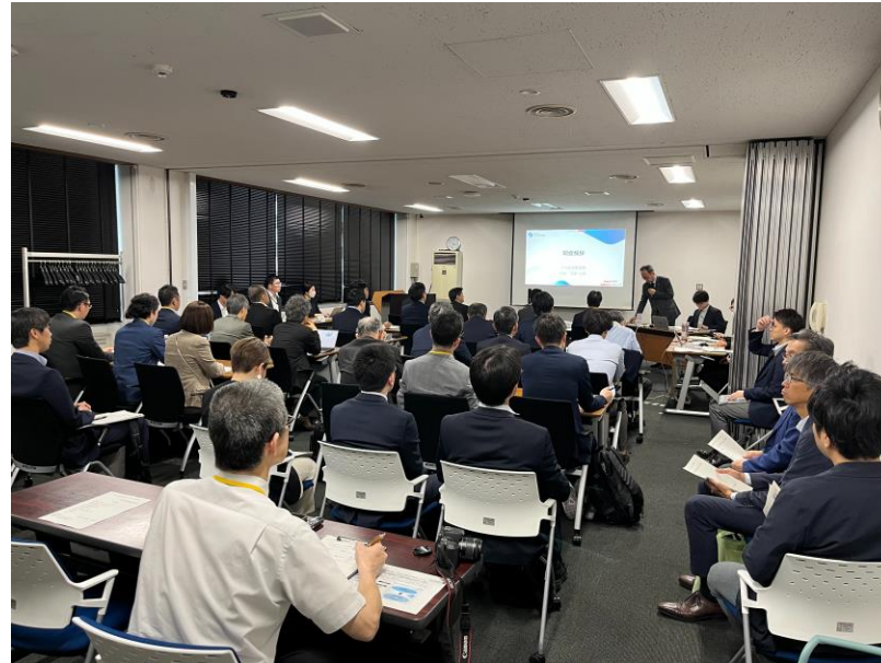
(会場：福岡合同庁舎本館6階 第2・3会議室)