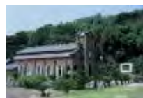
長崎の教会群と キリスト教関連遺産