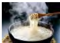
五島手延べうどん