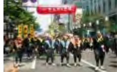
博多どんたく港まつり