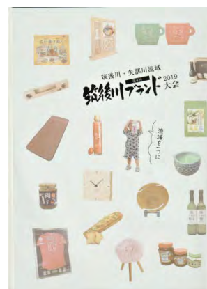
第4回筑後川ブランド大会のパンフレット