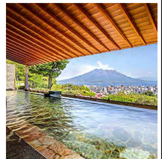
【宿泊施設から眺める桜島】

鹿児島県及び観光連盟、役務を提供する市町村及び観光協会、観光事業者等と広く連携し、新商品開発、プロモーション、受け入れ態勢整備等に取り組む。