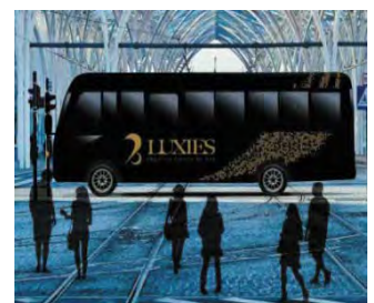
【富裕層向けコーチ「LUXIES」】