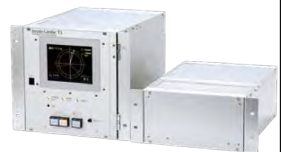
変圧器励磁突入電流抑制装置 【商品名 Inrush-Limiter T1】