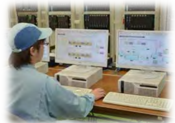
【プラントの制御システム開発】

製品安定供給の観点から、地域の材料・部品供給者や部分的な生産委託先との連携体制を構築する。また、製品の安全性・品質の確保のための製品規格適合検査時に宮崎県工業技術試験センター等を活用する。さらに、展示会などの販路開拓において当社関係先と連携して、商品情報の発信に取り組む。