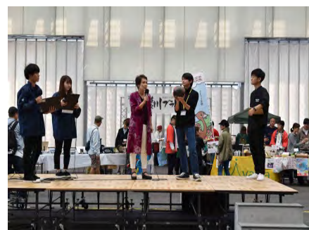
事業者と学生によるPRの様子