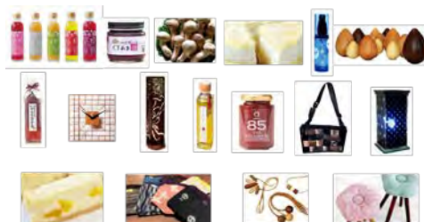
筑後川ブランド認定品(第1回～第4回)