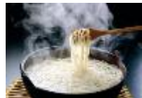
五島手延べうどん