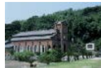
長崎の教会群と キリスト教関連遺産