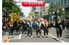
博多どんたく港まつり