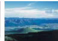
阿蘇くじゅう 国立公園