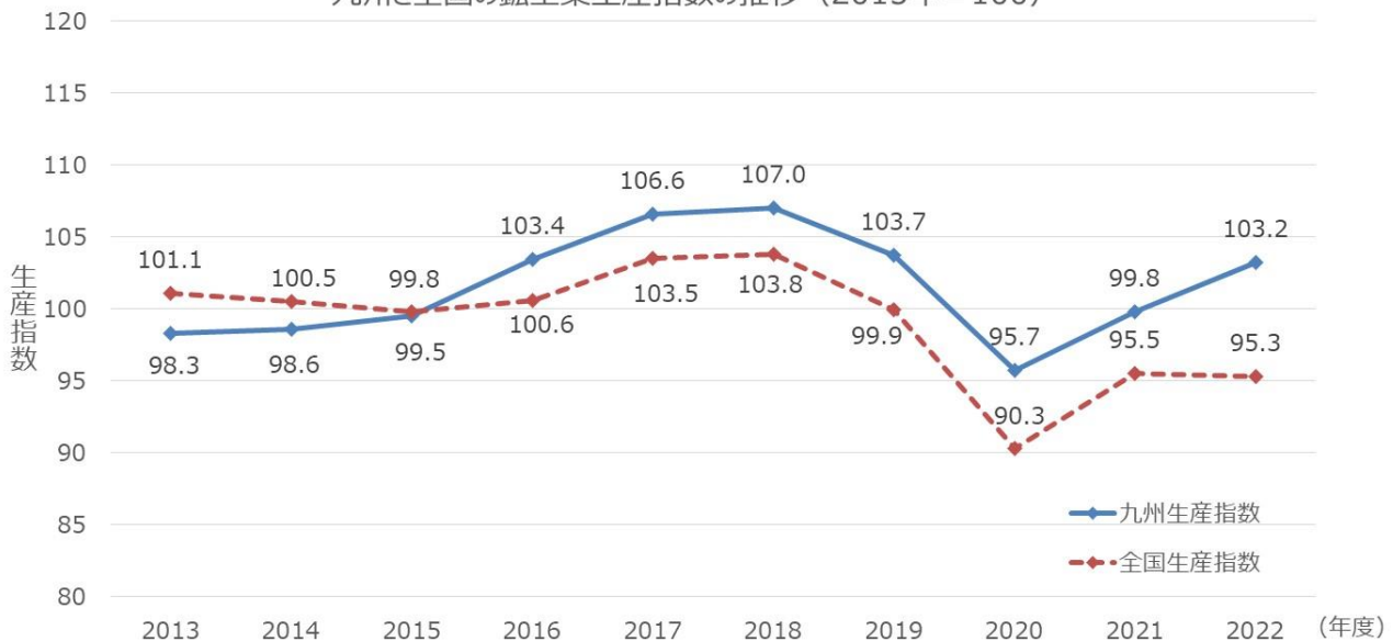
九州と全国の鋳工業生産指数の推移（2015年＝100）