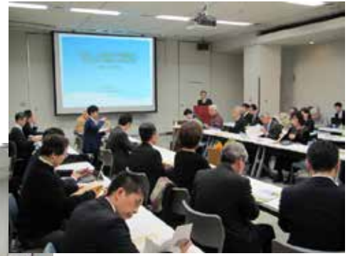
会場の様子 (熱心に聴き入る参加者)