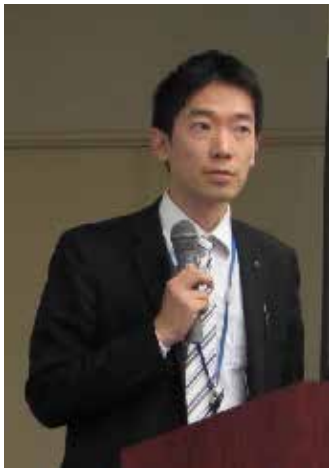
プレゼンの様子 <凸版印刷(株)>