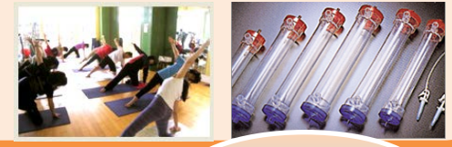
ヘルスケアツーリズム

健康長寿を目指した予防医療・健康増進サービスの産業創出 医療機器分野への参入促進・海外展開 先進医療・治療分野における新産業の創出 機能性・健康食品関連産業の活性化 化粧品関連産業の振興