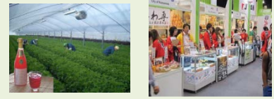
食と観光 グリーンツーリズム

海外市場への展開促進 国内外の販路開拓・最適生産体制構築 九州ブランドの創設 物流・輸送システムの強化 事業規模の拡大・安定供給体制の構築 農村発の再生可能エネルギーの活用 農山漁村の振興