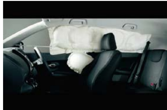
シリコンコーティングされたサイドカーテンエアバッグ